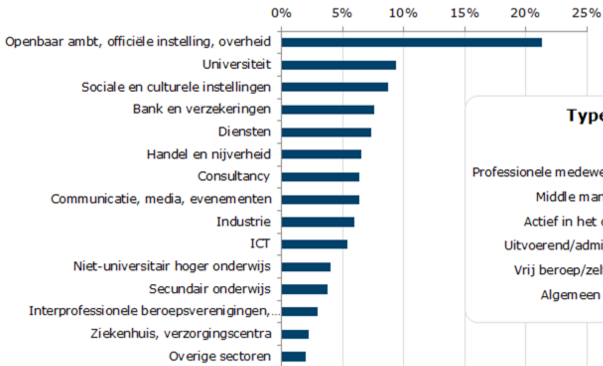
Sectoren van tewerkstelling alumni SW